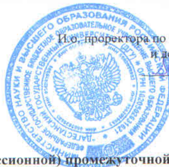
График организации повторной (комиссионной) промежуточной аттестации по направлению подготовки 38.03.01 Экономика (уровень бакалавриата) профиль: Финансы и кредит форма обучения: очно-заочная филиала ДГУ в г.Дербенте 2025-2026 учебного года Курс 2 семестр 3 Зачеты