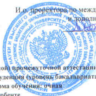
График организации повторной (комиссионной) промежуточной аттестации по направлению подготовки 40.03.01 Юриспруденция (уровень бакалавриата)

профиль: Уголовно-правовой форма обучения: очная